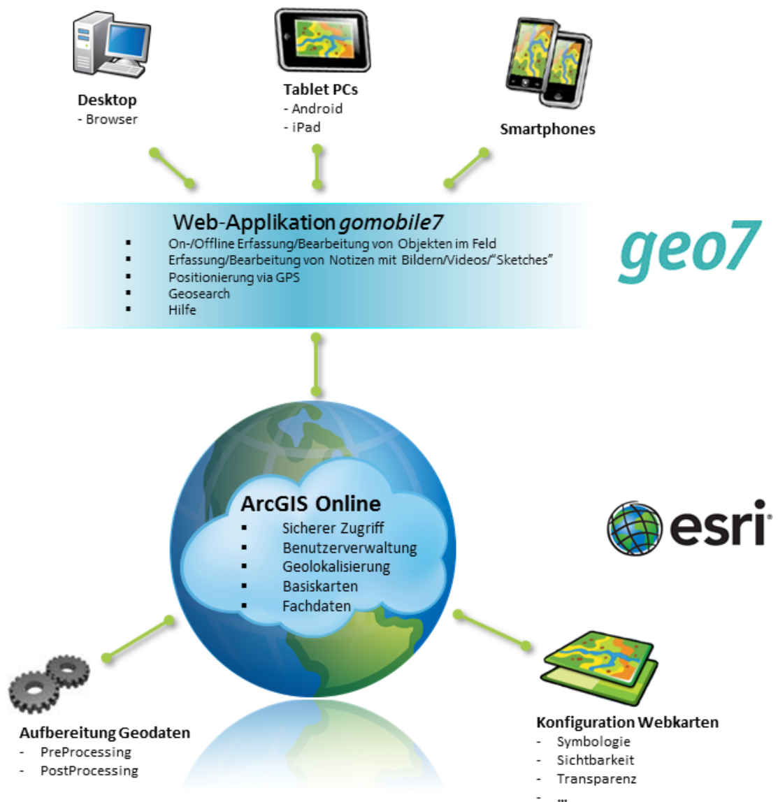
Abb. 3: Systemarchitektur mit Übersicht auf die Komponenten