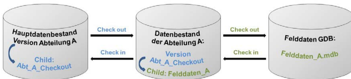
Abb. 2: Anschauungsbeispiel eines Prozessflusses der bisherigen mobilen GIS-Datenerfassung

Um grössere Datenbestände zentraler Infrastrukturen mit mobilen Endgeräten für den Feldeinsatz bereitzustellen, musste man sich bisher komplizierter Verfahren für die Vor- und Nachbereitung bedienen. Dabei begrenzte zum einen der Speicherplatz auf den Endgeräten die im Feld bearbeitbaren Datenbestände, zum anderen war die Direktverbindung zur Datenbank (online) nicht flächendeckend und permanent gewährleistet. Abhilfe schafften hier Systeme mit der Möglichkeit, durchgängig offline zu arbeiten (disconnected editing). Hierbei bediente man sich aufwändiger Methoden, um den Datenbestand unter Berücksichtigung von Filtern und topologischen Regeln zunächst aus der Masterdatenbank zu extrahieren. Dieser wurde in verschiedenen Childversionen (Partitions) unterteilt, um sie dann auf dem Endgerät für die Feldarbeiten mitzuführen (Check-Out).