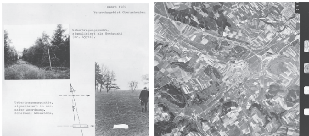
Abb. 3: Testfeld Oberschwaben (Punktsignalisierung, Luftbild).

Mit dem Einzug der Computer ins Vermessungswesen in den 1960er Jahren kam eine andere Entwicklungslinie zum Vorschein: Das Digitale Geländemodell (DGM). Obwohl die Fa. IBM bereits zu Anfang der 1960er Jahre ein umfangreiches DGM-Programmpaket für Anwendungen im Straßenbau und der Flurbereinigung anbot, der Zeitpunkt offensichtlich