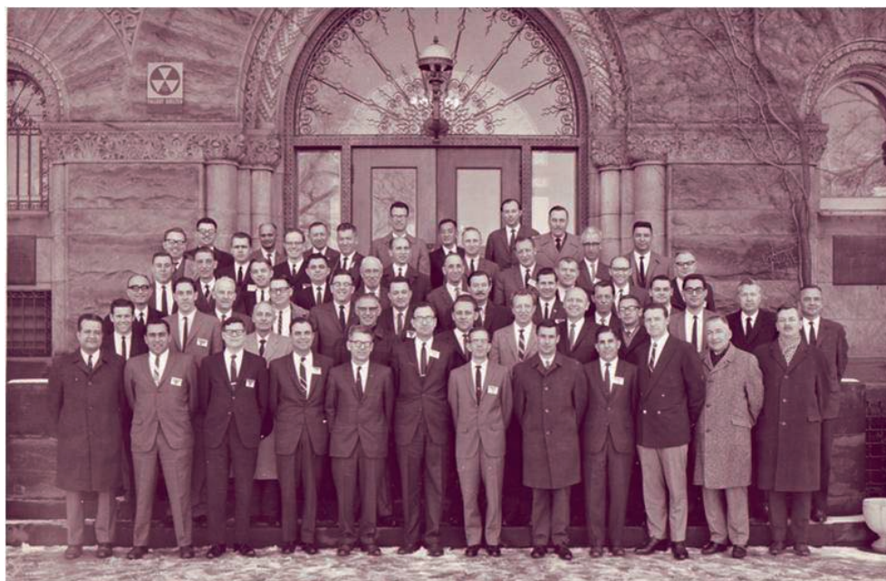
Abb. 4: Teilnehmer des Symposiums Analytische Photogrammetrie, Urbana-Champaign, Illinois, USA, 1966 (Prof. ACKERMANN befindet sich in der zweiten Reihe von unten).

chung mit unabhängigen Modellen und Auswertung photogrammetrischer Bündel) hinwies. Für ihn steht fest, dass Prof. ACKERMANN zu den Pionieren der Einführung dieser Methoden in die photogrammetrische Praxis zählt. Des Weiteren ging er auf die Selbstkalibration und die damit verbundene Genauigkeitssteigerung der Aerotriangulation ein. Es folgten persönliche Wahrnehmungen zur Nutzung des kinematischen DGPS zur direkten Messung von Orientierungsparametern sowie die Stuttgarter Darstellungen zur internen und externen Zuverlässigkeit von photogrammetrischen Blöcken. Digitale Geländemodelle und SCOP sind eine Kombination, die auch in den USA Aufsehen erregte. Ferner reflektierte er das Laserprofilung zur Erfassung von bewaldeten Gebieten, um ein DGM abzuleiten und darüber hinaus auch Durchdringungsraten zu ermitteln und damit Empfehlungen für den Datenerfassungszeitpunkt auszusprechen. Sein Vortrag wurde abgeschlossen mit den Anerkennungen zur automatischen DGM-Generierung mittels Kleinster-Quadrate-Zuordnung, der Automatisierung der Aerotriangulation wie auch dem MOMS02-Projekt.